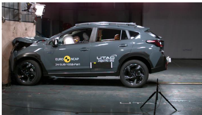
Euro NCAP impact test on Crosstrek

Ακόμα ένα Subaru γίνεται 5άστερο! Το νέο Crosstrek (ευρωπαϊκών προδιαγραφών) πέτυχε τη μέγιστη συνολική βαθμολογία των πέντε αστεριών στις δοκιμές ασφαλείας του Ευρωπαϊκού Προγράμματος Αξιολόγησης Νέων Αυτοκινήτων 2024. Το νέο Crosstrek κατέγραψε εξαιρετικές βαθμολογίες και στις τέσσερις περιοχές αξιολόγησης (Ενήλικος επιβάτης, Ανήλικος επιβάτης, Ευάλωτοι χρήστες δρόμου, Υποβοήθηση Ασφάλειας), πολύ πάνω από το ελάχιστο απαιτούμενο όριο.